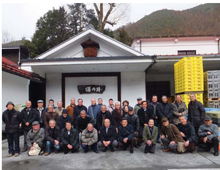
小澤酒造酒蔵見学